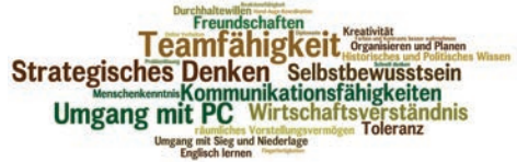
Abbildung 3: Kompetenzen_gameinfo 2012

Unzählige gefunden. In der von uns durchgeführten Forschung wurden unter anderem Kompetenzen wie das Strategische Denken, die Teamfähigkeit, der Umgang mit der Hardware, aber auch Wirtschaftsverständnis erwähnt. Doch eins ist klar: KEINE der