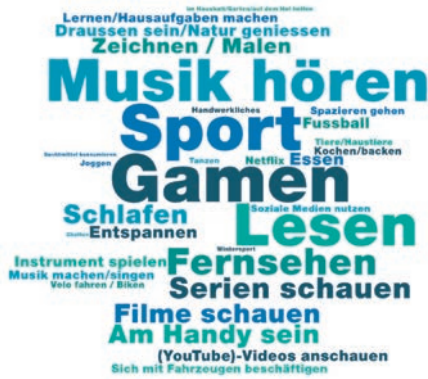
Abbildung 1: James 2018 Lieblingsbeschäftigung

Es ist offensichtlich, dass Gamem eine der wichtigsten Freizeitbeschäftigungen der Ju-