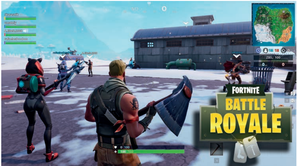
Abbildung 5: Fortnite_Ingame-Screenshot

möglichkeiten bis hin zur Organisation von Gameevents und Turnieren.