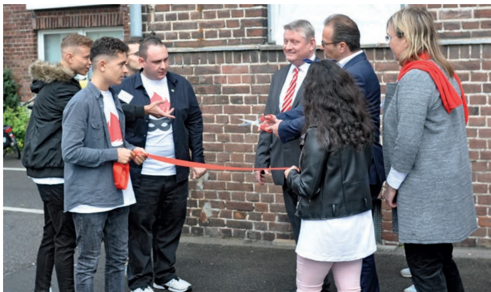
Eröffnungsfeier im Oktober 2019

geschaffen werden, die mit den Zielen des Trägers nachhaltig und kontinuierlich umgesetzt werden kann. Hierbei war und ist der Bauverein Neuss AG eine große Hilfe. Er half uns, die entsprechenden Räumlichkeiten zu finden und unterstützte uns bei der Umsetzung. Gemeinsam mit dem Jugendvorstand der Interkulturellen Projekthelden und vielen ehrenamtlichen Helfern schafften wir es in kurzer Zeit, ein Jugendzentrum zu errichten.