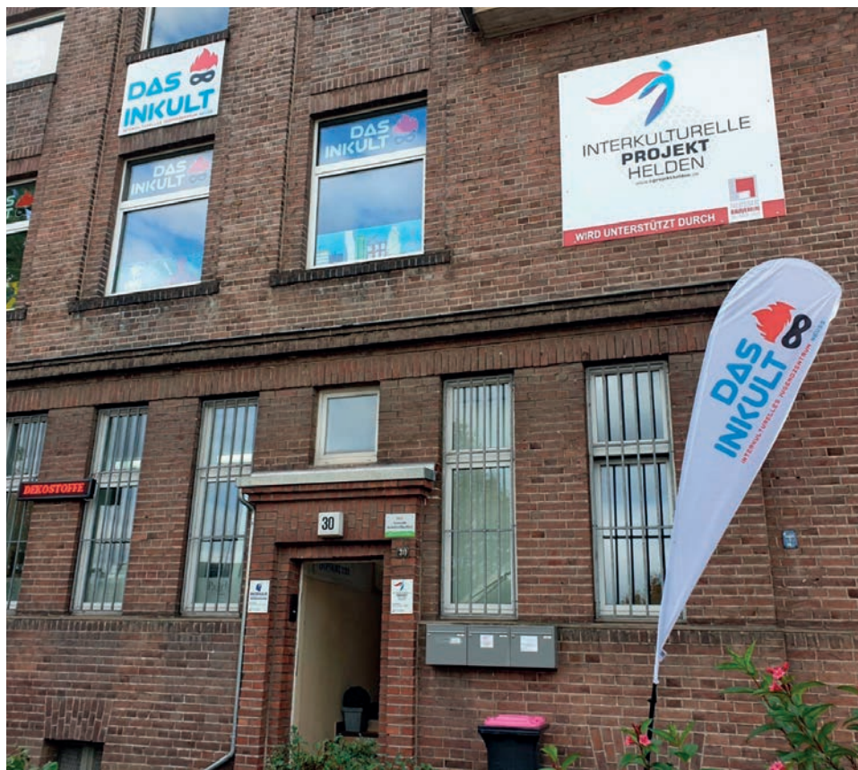
Das InKult in Neuss

terkulturellen Projekthelden stammen, um so möglichst viele Kinder aus verschiedenen sozialen und kulturellen Kontexten zusammenzubringen.