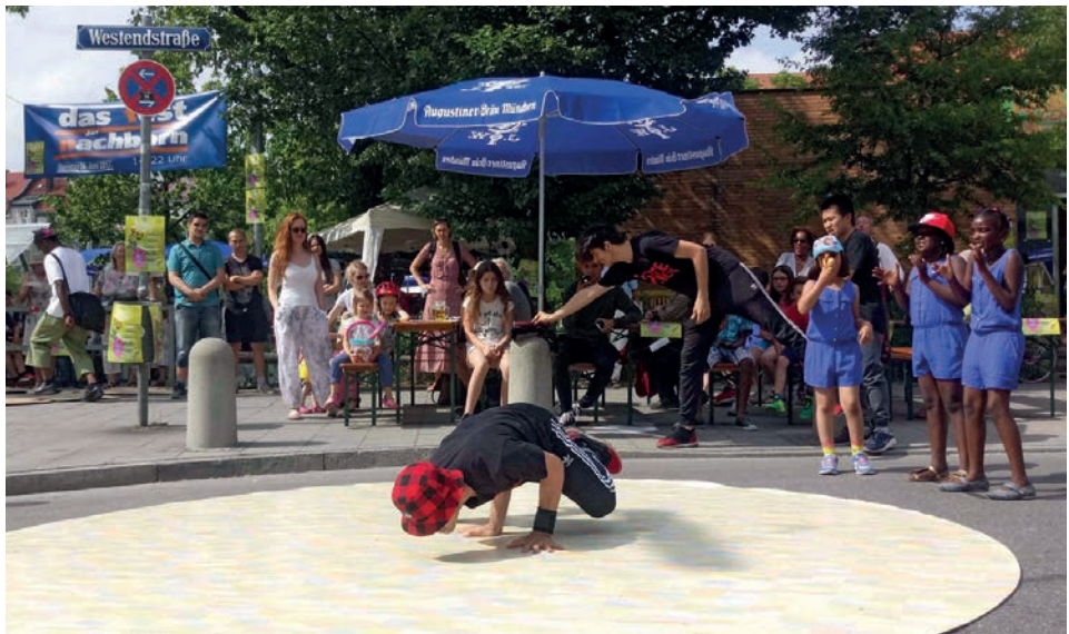
Fest der Nachbarn